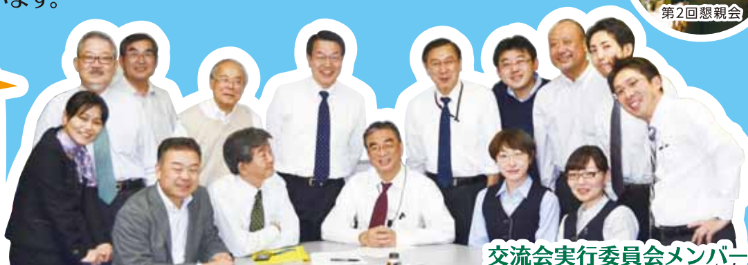
交流会実行委員会メンバー

第3回では、3名の講師をお招きして、選ばれるためにはどうすべきか!? 採用・雇用の対策は??、金融機関からの視点などのテーマでお話していただくことになっております。今回以降は本交流会開催に先立って設立いたしました一般社団法人シニアビジネス支援機構が主体となって運営し、安定的かつ継続的にビジネスマッチングの場を提供できるようになります。