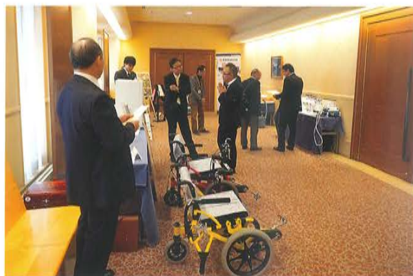
商品展示ブースの様子

ジネス情報のご案内をいただくことができ、参加された皆 様も真剣に耳を傾けておりました。参加企業における商品 展示ブースなども用意することができ、プレゼン終了後には 各企業ブースにて実際に商品を体験することもできました。 数多くの製品やサービスを同じ場所で実際に手にと って触れることが出来ることはなかなかありませんので、参加 者の皆様にとって今回の交流会は貴重な機会になったの ではないでしょうか。